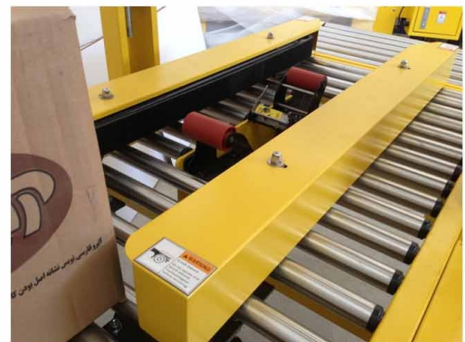
استفاده از غلطک های ضد سایش و طول عمر بالای قطعات